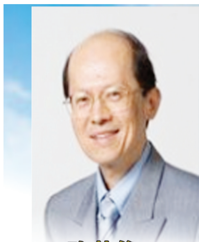
新加坡陈英俊医生供稿